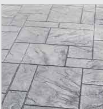
رندوم اسلیت طوسی