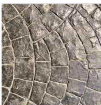
فلسی طوسی دودی