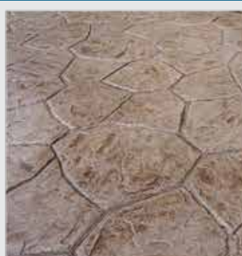
مالون قهوه ای