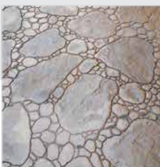
سنگ رودخانه ای