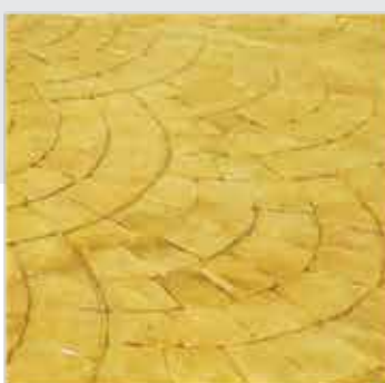
فلسی زرد بژ